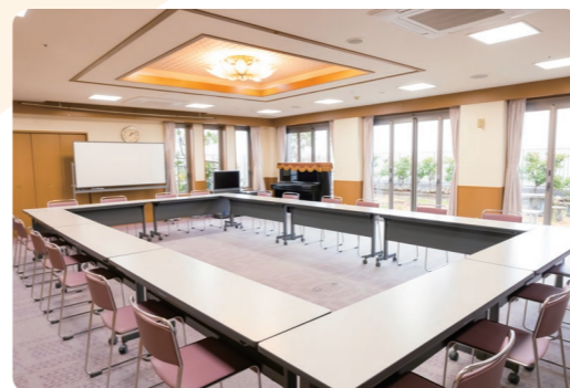
レクリエーションや会議・研修に使用しています。