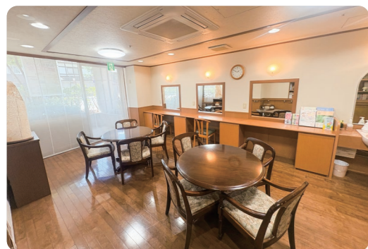
カンファレンスや訪問理美容等に使用しております。